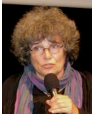
Colline Serreau invitée en juin 2010 des Amis de Cinéma