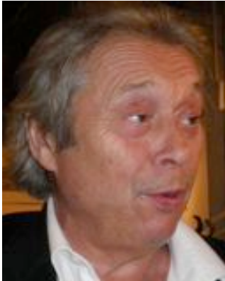
Patrick Bouchitey invité du festival 2010 Rencontres Cinéma