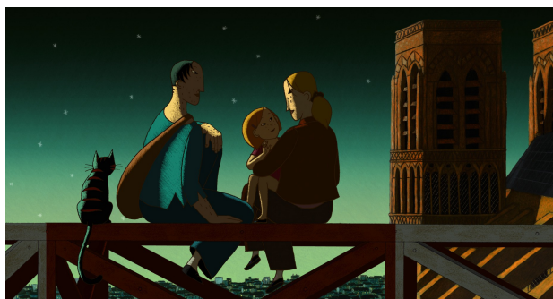
Une Vie de chat

Dino est un chat qui partage sa vie entre deux maisons, celle de Zoé, une petite fille mutique, et celle de Nico, un cambrioleur solitaire. Jeanne, la maman de Zoé, est commissaire de police. Elle doit arrêter l'auteur d'une série de vols et gérer le transport d'une statue convoitée par l'ennemi public numéro un, Victor Costa. Ce dernier est